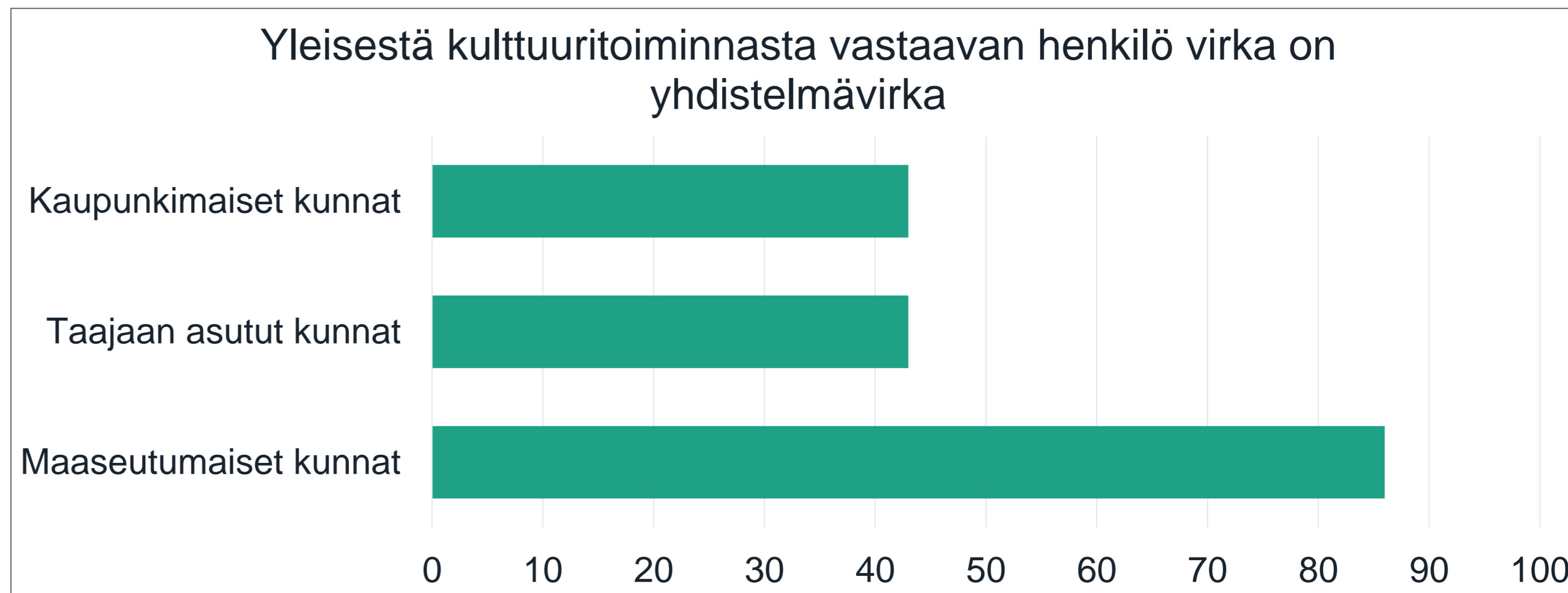
Yleisestä kulttuuritoiminnasta vastaavan henkilö virka on yhdistelmävirka

Lähde: Peruspalvelujen arviointi 2019, julkaisematon